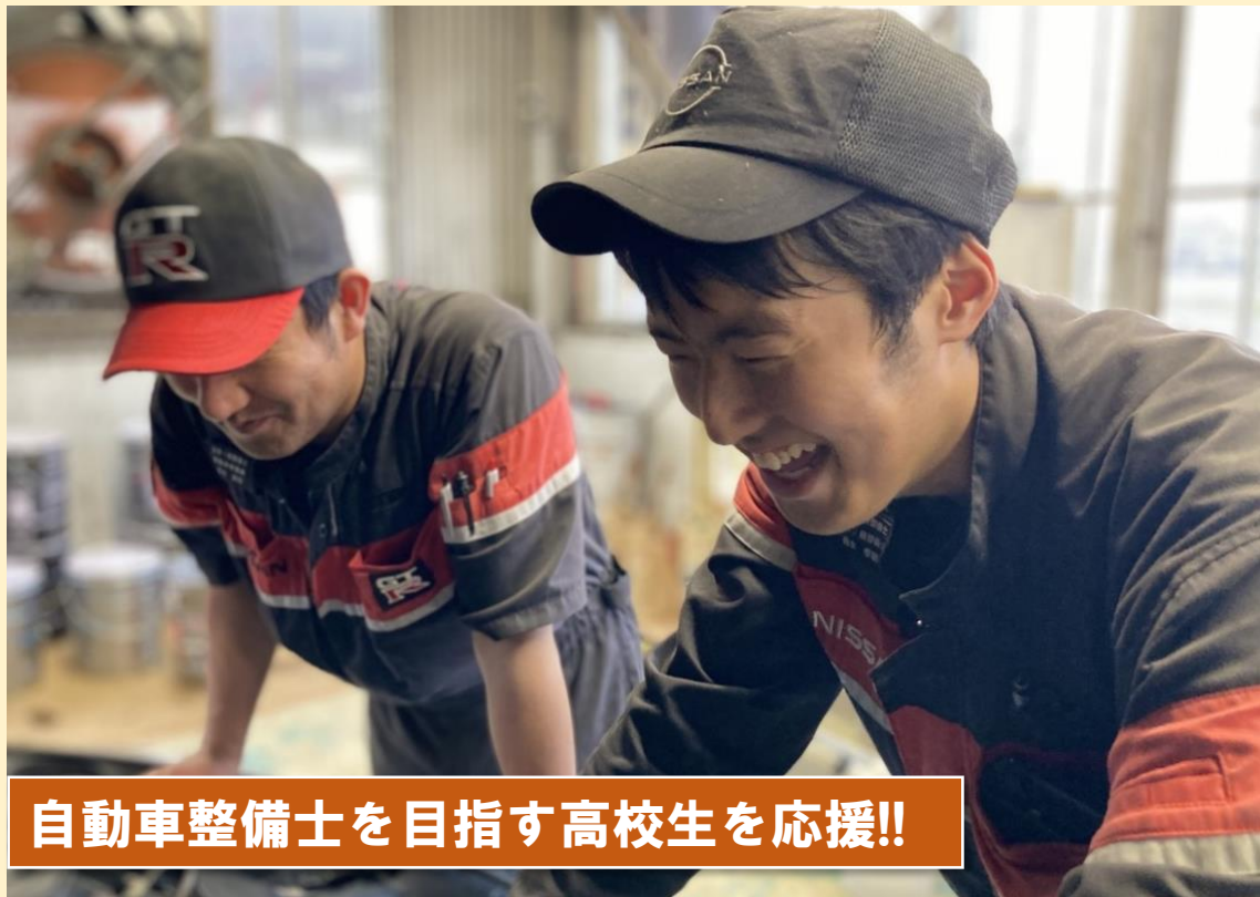
自動車整備士を目指す高校生を応援!!